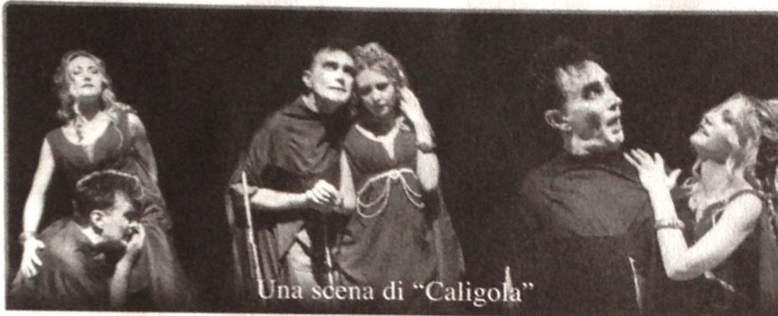
Una scena di "Caligola"